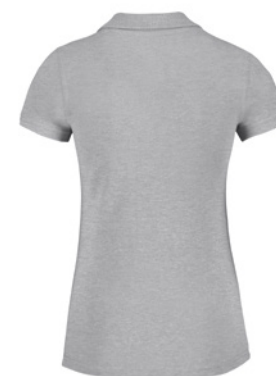
B&C Safran Timeless /w. P. 197