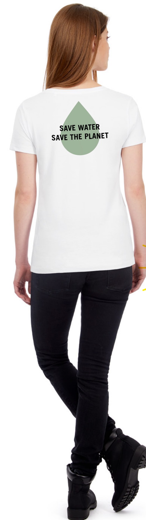
B&C Inspire Plus T /w. P. 153