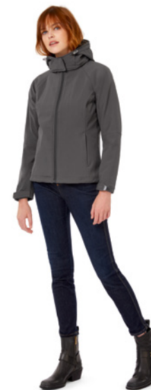
B&C Hooded Softshell /w. P. 290