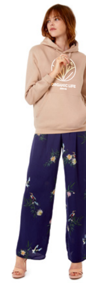
B&C Hooded P. 271