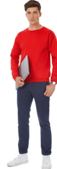
B&C ID.202 50/50 P. 282