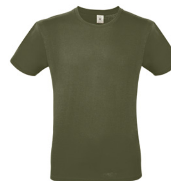
B&C #E150 P. 124

De perfecte fundraiser is duurzaam, nuttig, inzamelbaar en moet passen bij uw missie. Hou het cool en aangepast aan uw doelpubliek.