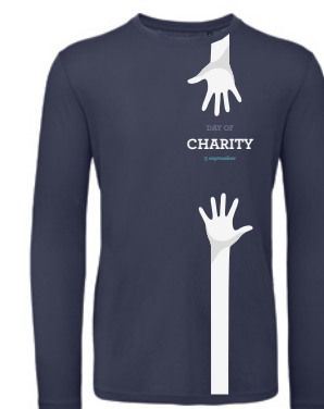
B&C Inspire LSL T /men P. 148