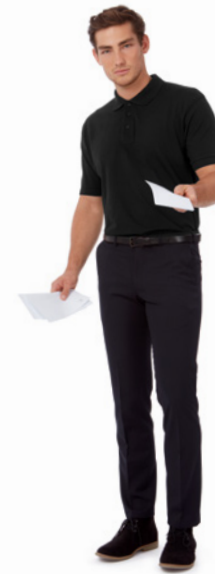
B&C Heavymill P. 204