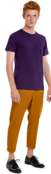
B&C Inspire T /men P. 144