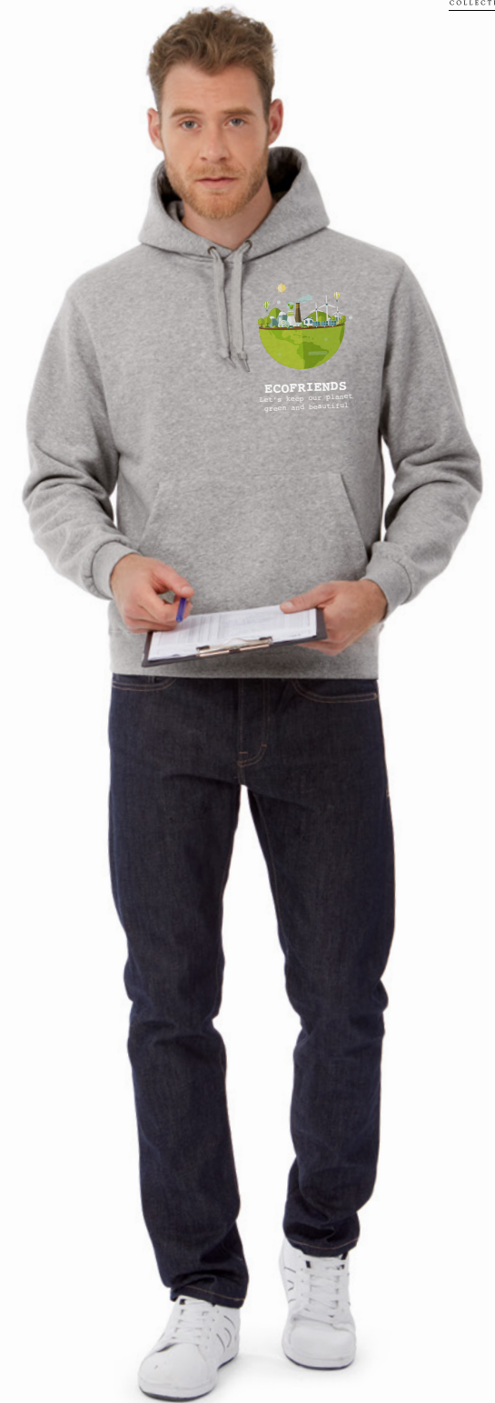
B&C Hooded P. 271