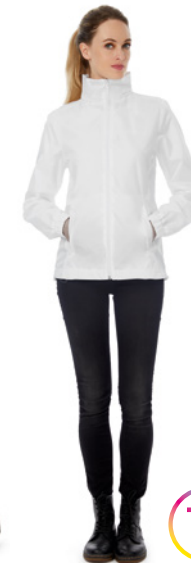
B&C ID.601 /women P. 332