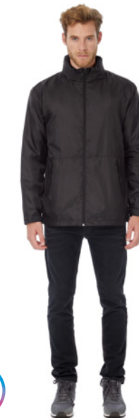
B&C Multi-Active /men P. 320