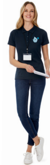
B&C Safran Timeless /w. P. 197