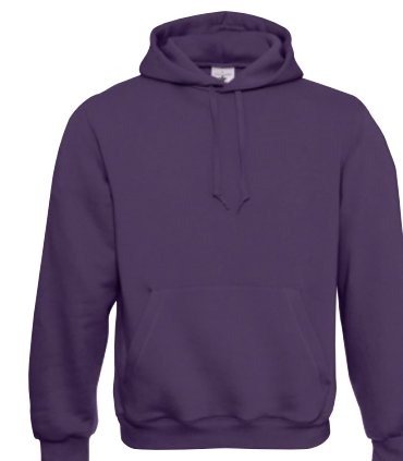
B&C Hooded P. 271