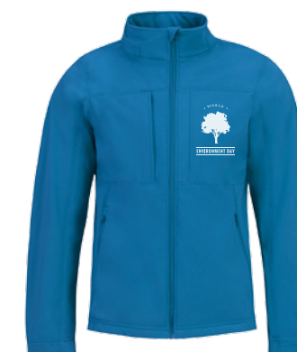
B&C Hooded Softshell /m. P. 290