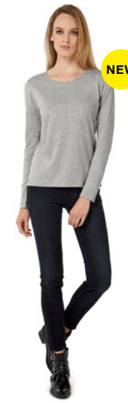
B&C #E150 LSL /w. P. 129